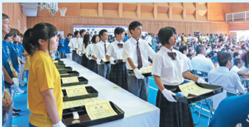
カヌー競技閉会式で表彰の補助をする久美浜高校の生徒たち(久美浜小学校体育館)

平成27年度全国高等学校総合体育大会「2015 君が創る 近畿総体」が「風になれ 今青春が走り出す」のスローガンのもと開催されました。京都府では、7月28日から8月20日まで、水泳、バスケットボール、バドミントン、レスリング、ホッケー、カヌーの6競技に、全国の予選を勝ち抜いた選手約6,600名が集まりました。猛暑の中、連日熱戦が繰り広げられ、選手の皆さん以外にも、約3,700名の府内高校生が大会を支える補助員として大いに活躍しました。競技会場周辺の清掃活動や歓迎会の栽培をはじめ、本大会に向けた講習会やリハーサルなどに参加し補助員としての技術習得に努めるなど、大会開催前から高校生最大のスポーツの祭典に向けて入念な準備に当たりました。大会期間中は、式典や競技の運営全般にわたって、きびきびとした高校生のすばらしい働きで見事に大会をサポートし、さわやかで実りある大会となりました。