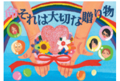
平成25年度 人権擁護啓発ポスターコンクール 京都府人権擁護委員連合会長賞 与謝野町立加悦中学校1年生(受賞当時)

そうした一人ひとりの想像力が豊かになれば、誰もが幸せに暮らせる、「人権」が守られた世の中をつくることができるのではないのでしょうか。