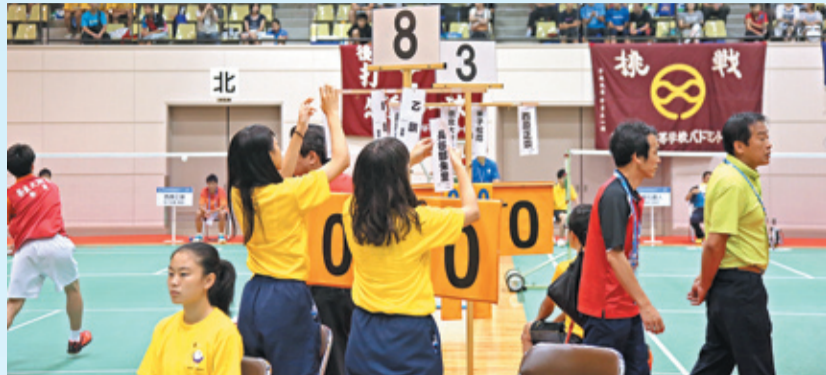
バドミントン競技シングルスで得点表示係をつとめる補助員(西山公園体育館)